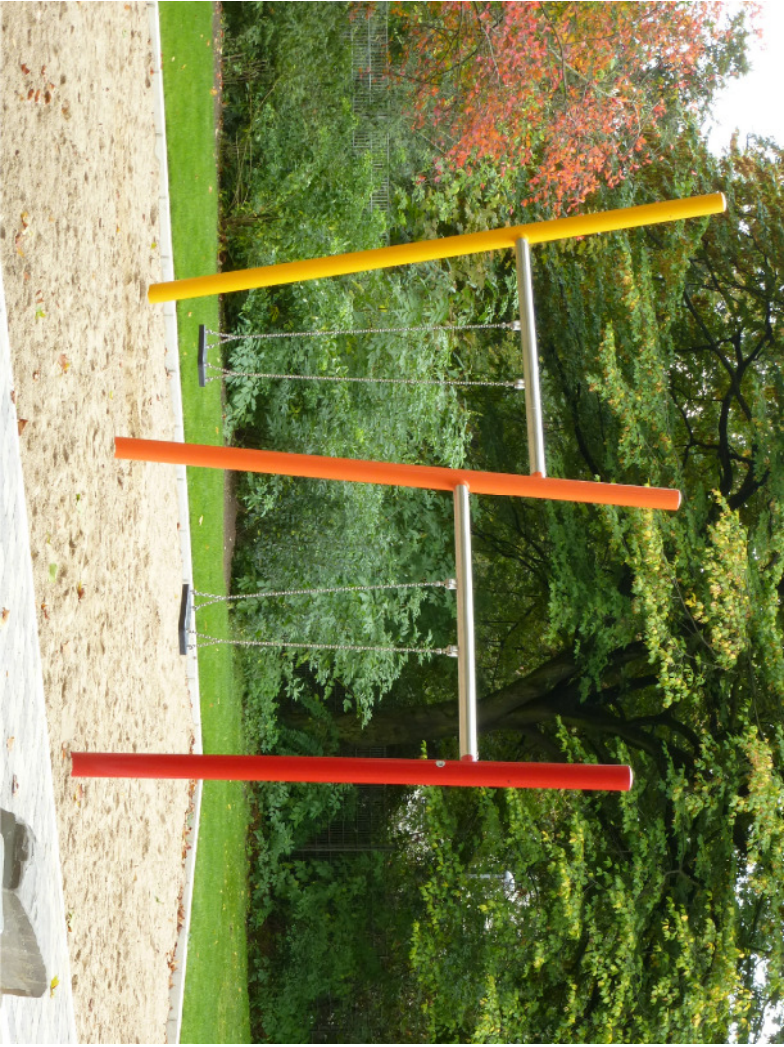
Doppelhorschauekel mit sicherheits-schaukelstulz